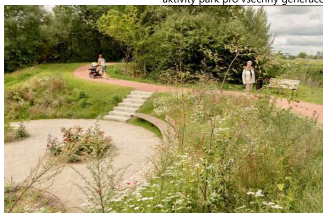
parková zákoutí a úpravy