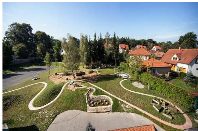
dětské hřiště pro nejmenší