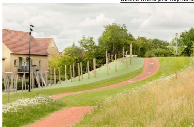
aktivity park pro všechny generace