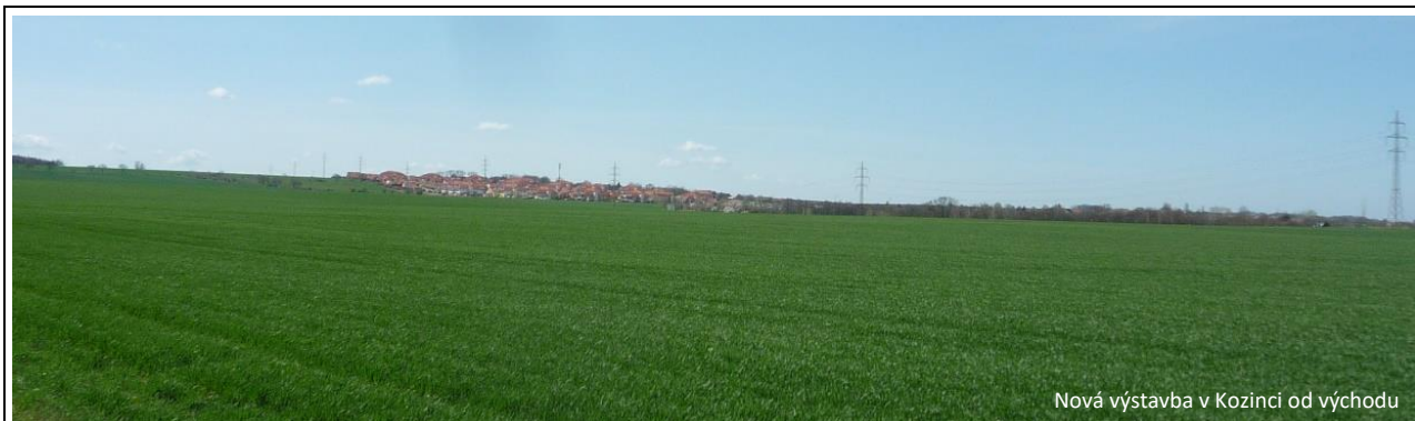
Nová výstavba v Kozinci od východu