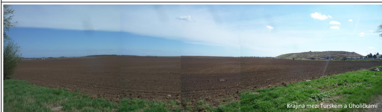
Krajina mezi Turskem a Úholičkami