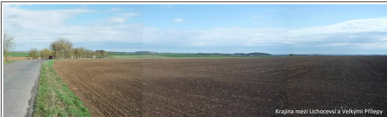
Krajina mezi Lichocevsí a Velkými Přílepy