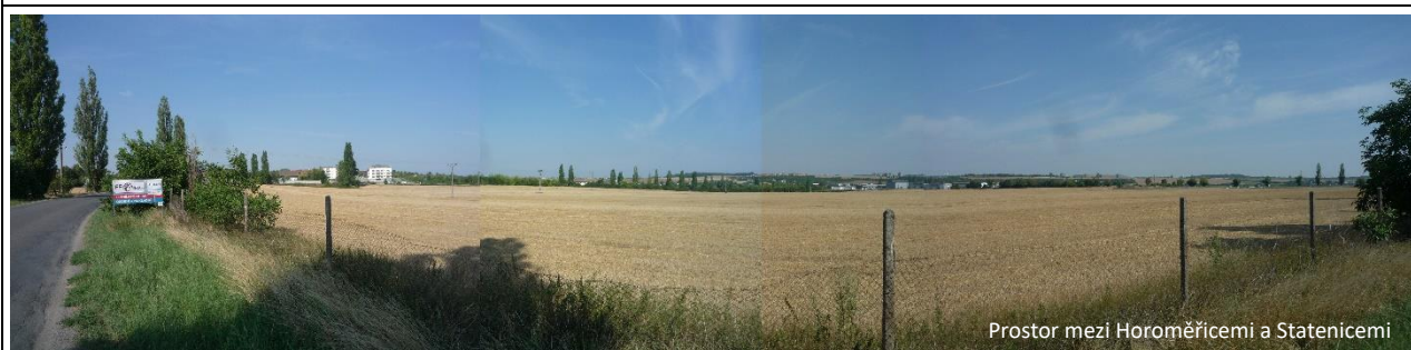
Prostor mezi Horoměřicemi a Statenicemi