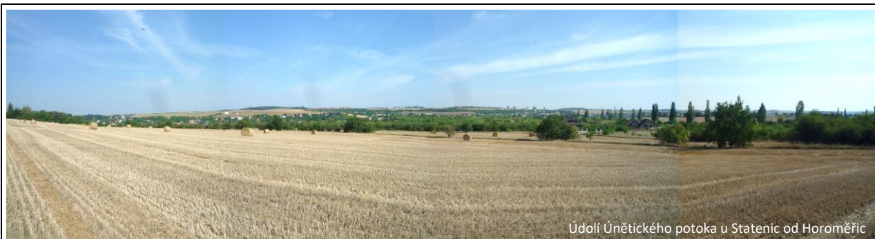
Údolí Únětického potoka u Statenic od Horoměřic