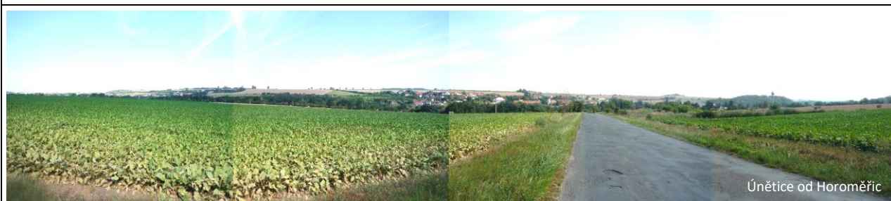
Únětice od Horoměřic