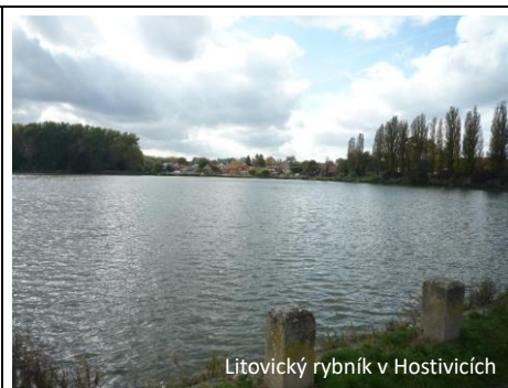
Litovický rybník v Hostivících