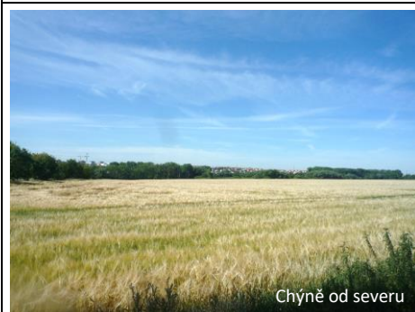
Chýně od severu