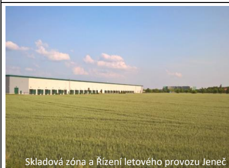
Skladová zóna a Řízení letového provozu Jeneč