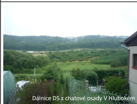
Dálnice D5 z chatové osady V Hlubokém