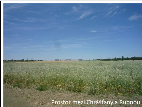
Prostor mezi Chrášťany a Rudnou