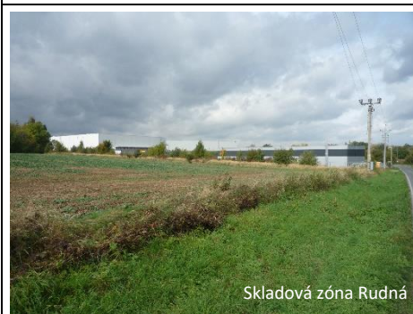
Skladová zóna Rudná