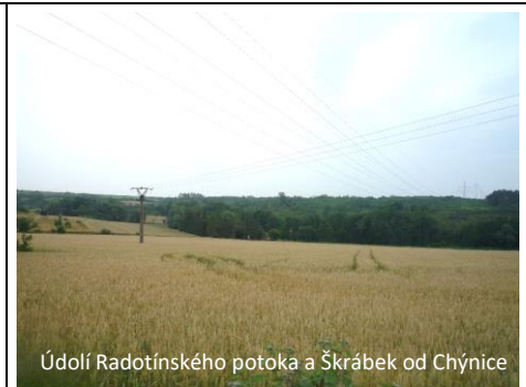
Údolí Radotínského potoka a Škrábek od Chýnice