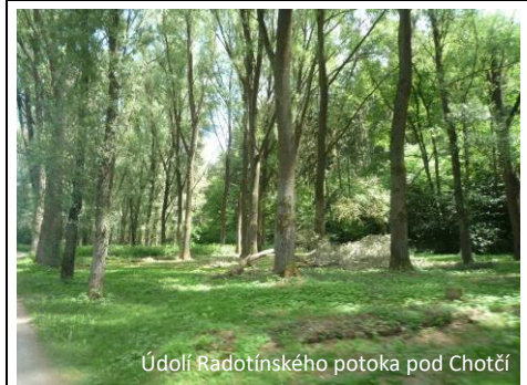
Údolí Radotínského potoka pod Chotčín