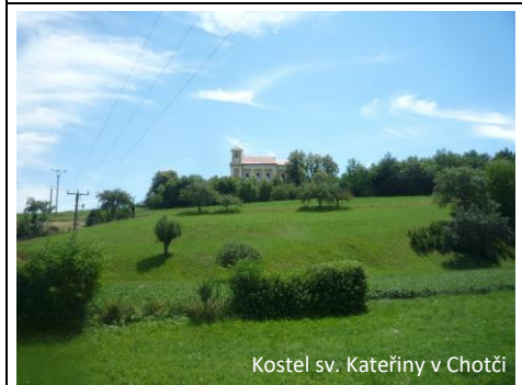
Kostel sv. Kateřiny v Chotčín