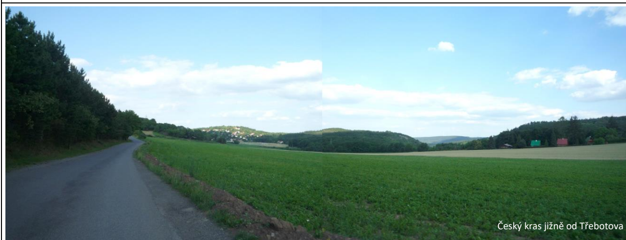
Český kras jižně od Třebotova