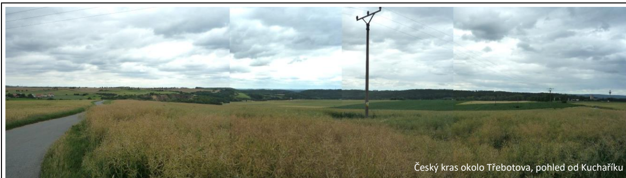
Český kras okolo Třebotova, pohled od Kuchařky