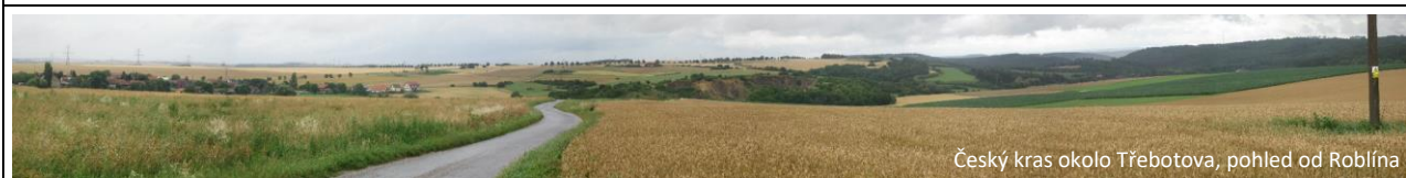
Český kras okolo Třebotova, pohled od Roblína