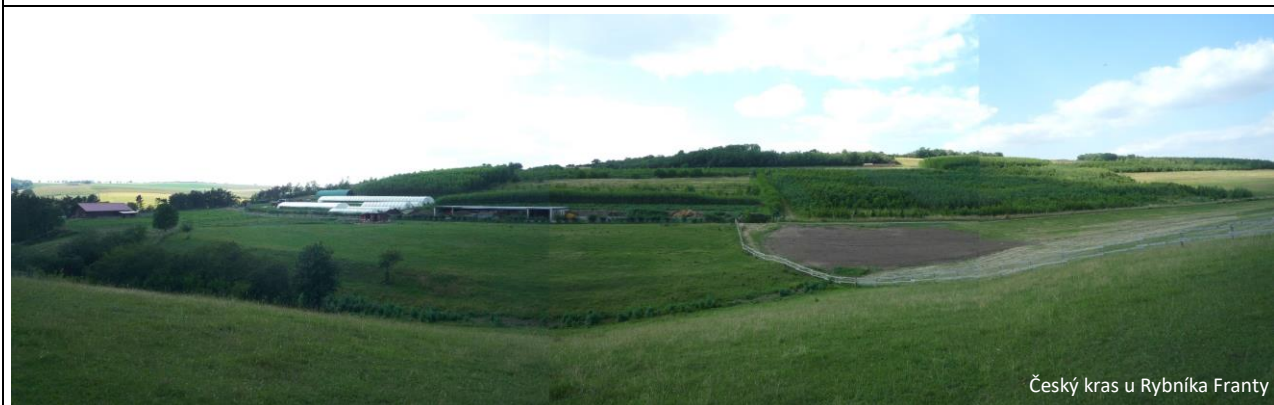
Český kras u Rybníka Franty