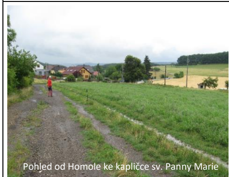
Pohled od Homole ke kapličce sv. Panny Marie