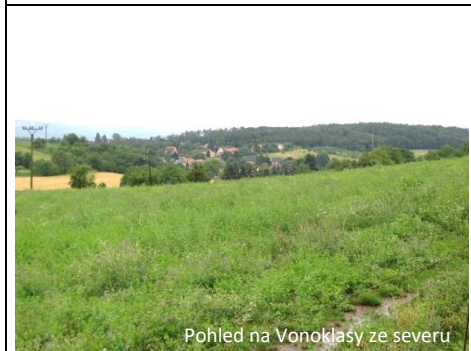
Pohled na Vonoklasy ze severu