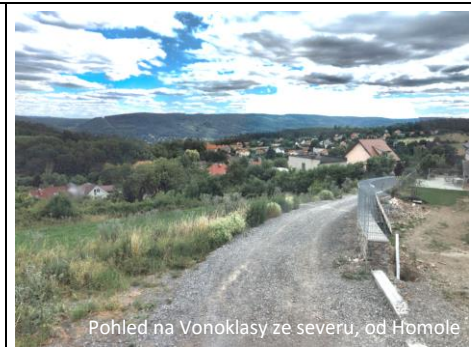
Pohled na Vonoklasy ze severu, od Homole