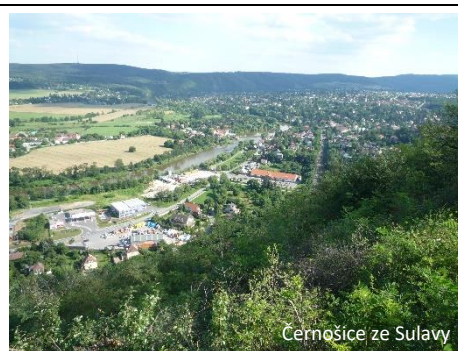
Černošice ze Sulavy