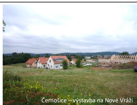
Černošice – výstavba na Nové Vráž