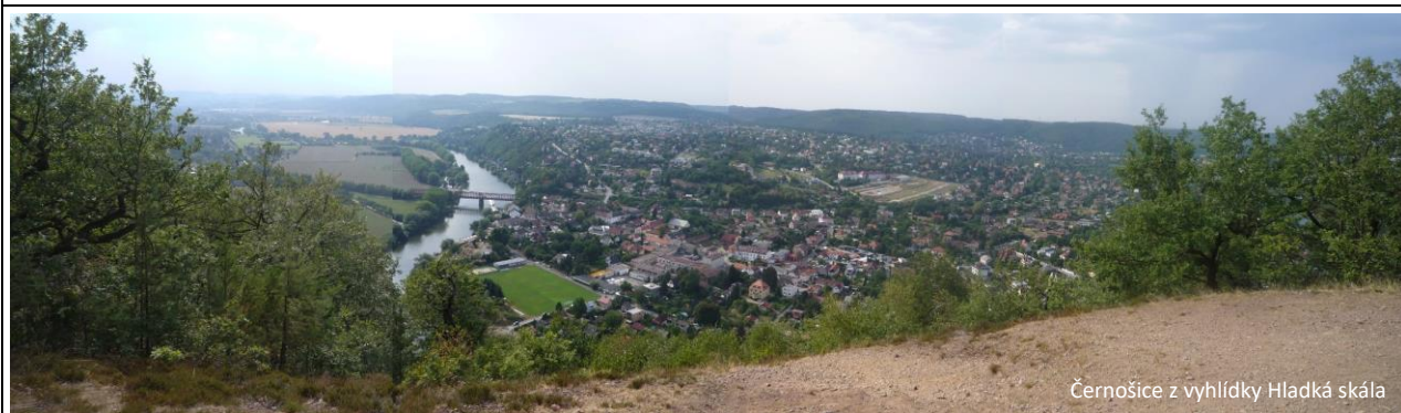
Černošice z vyhlídky Hladká skála