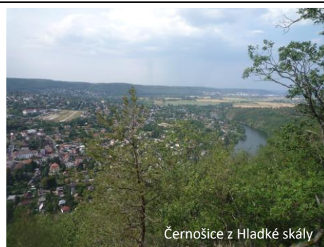
Černošice z Hladké skály