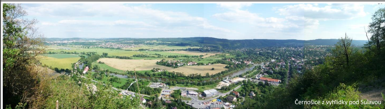
Černošice z vyhlídky pod Sulavou