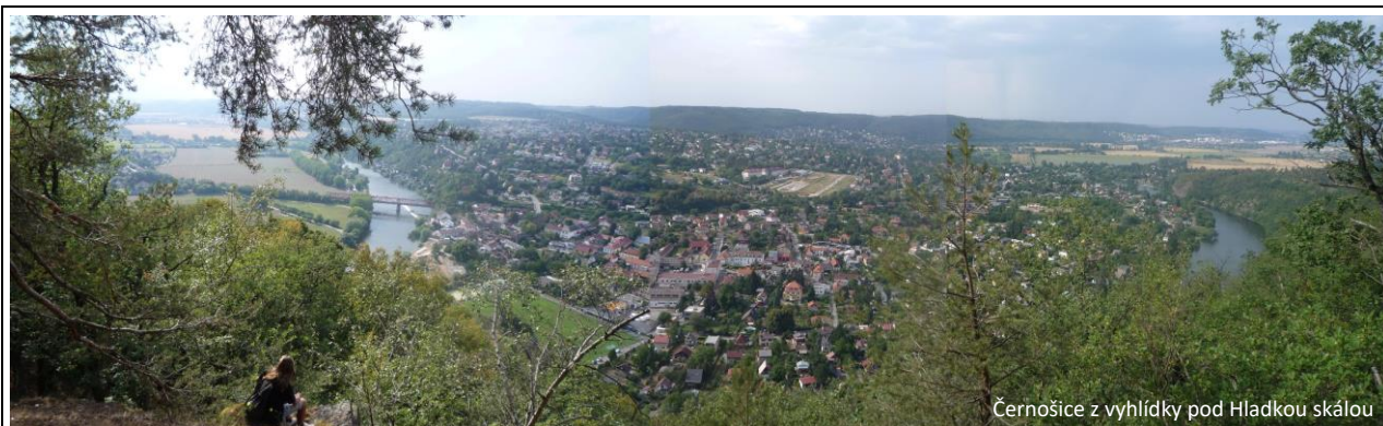
Černošice z vyhlídky pod Hladkou skálou