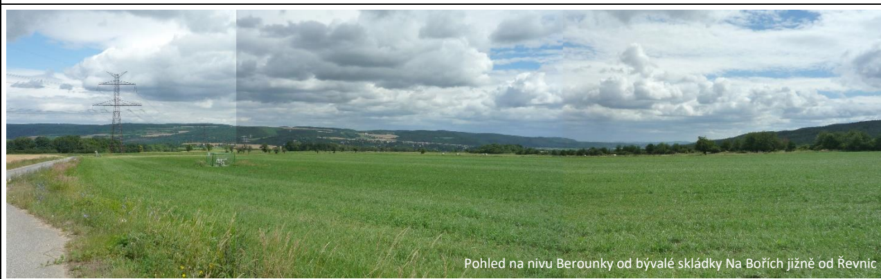
Pohled na nivu Berounky od bývalé skládky Na Bořích jižně od Řevnic