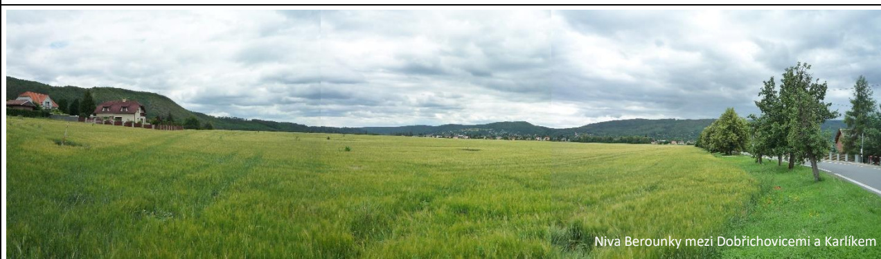
Niva Berounky mezi Dobřichovicemi a Karlíkem