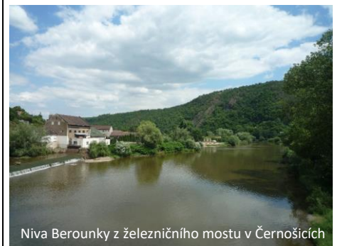
Niva Berounky z železničního mostu v Černošicích