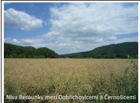
Niva Berounky mezi Dobřichovicemi a Černošicemi