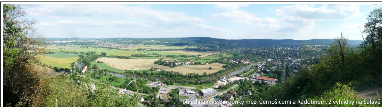
Pohled na nivu Berounky mezi Černošicemi a Radotínem, z vyhlídky na Sulavě