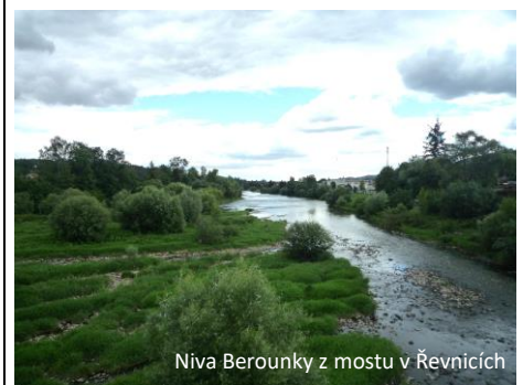
Niva Berounky z mostu v Řevnicích