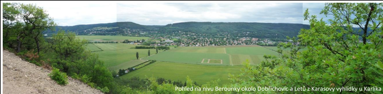
Pohled na nivu Berounky okolo Dobřichovic a Letů z Karasovy vyhlídky u Karlíka