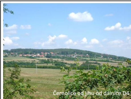
Černolice od jihu od dálnice D4