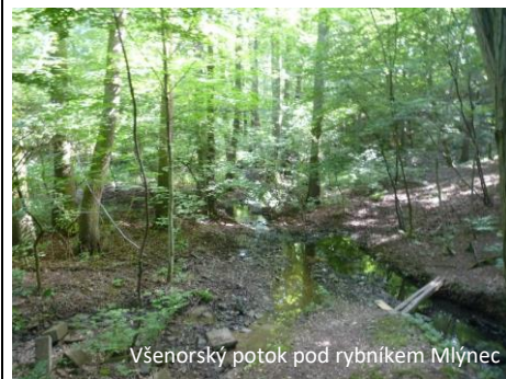
Všenorský potok pod rybníkem Mlýnec