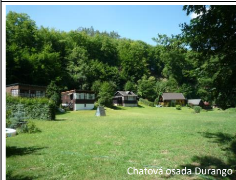
Chatová osada Durango