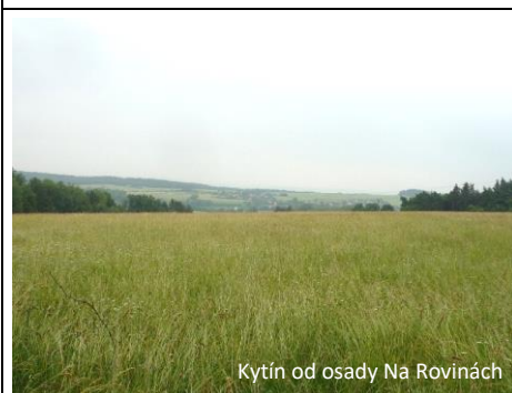
Kytín od osady Na Rovinách