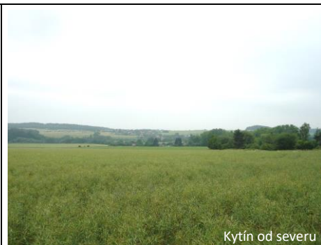
Kytín od severu