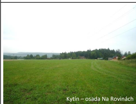
Kytín – osada Na Rovinách