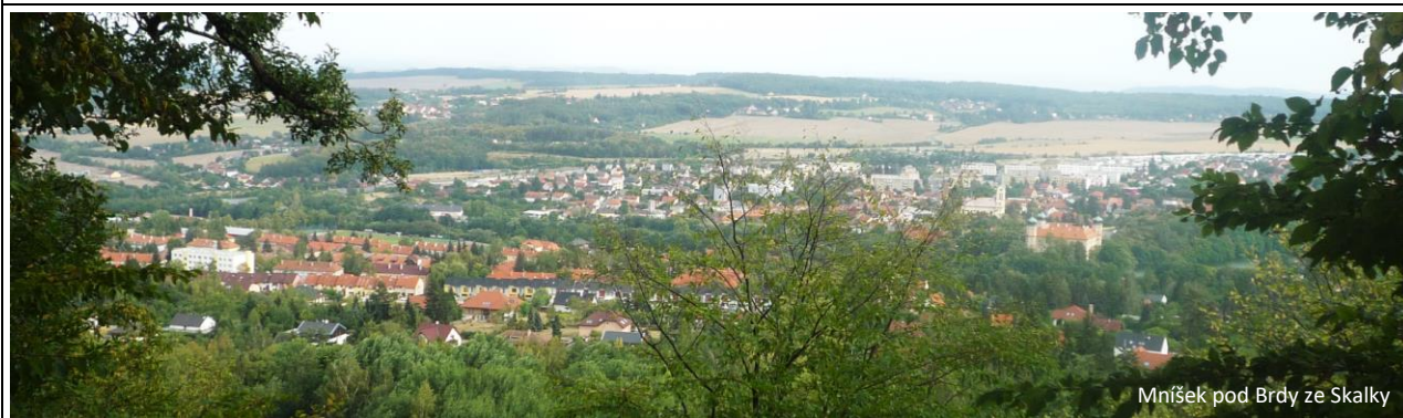
Mníšek pod Brdy ze Skalky