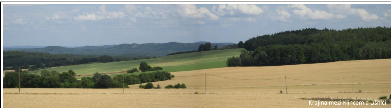
Krajina mezi Klínecem a Lišnicí