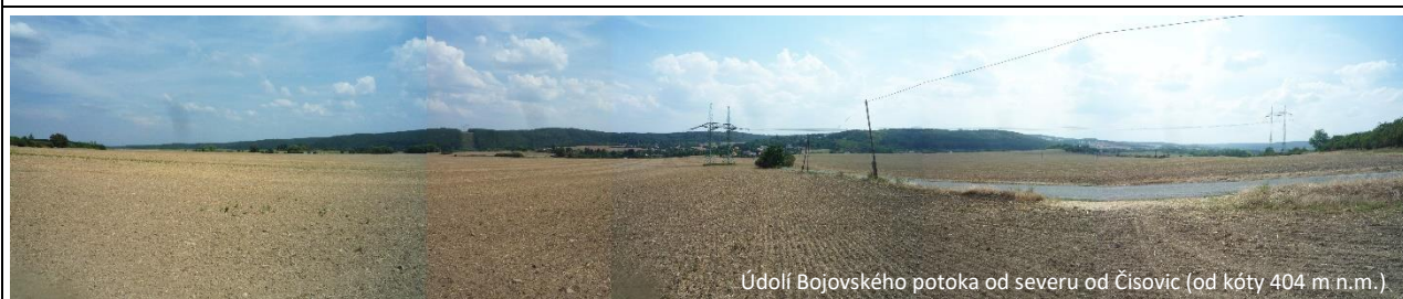
Údolí Bojovského potoka od severu od Čisovic (od kóty 404 m n.m.)