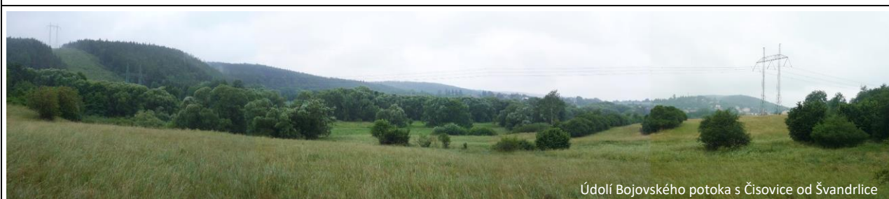
Údolí Bojovského potoka s Čisovicemi od Švandřovic