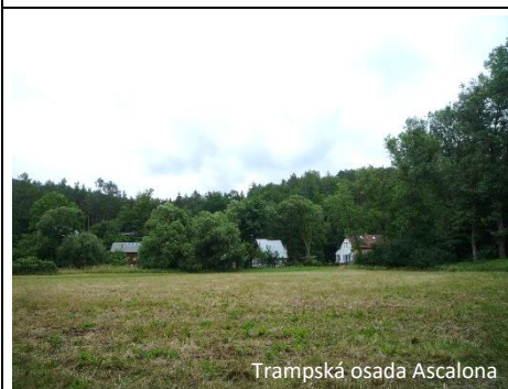
Trampská osada Ascalona