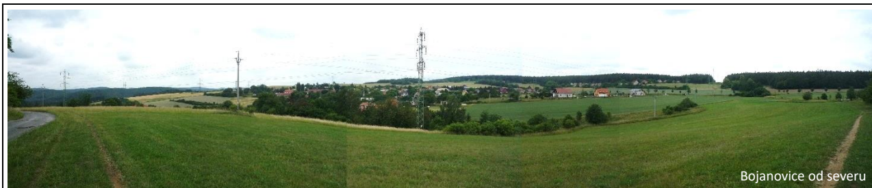
Bojanovice od severu