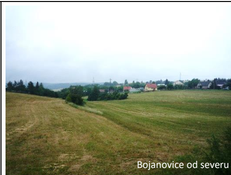
Bojanovice od severu