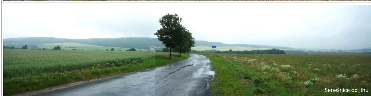
Senešnice od jihu