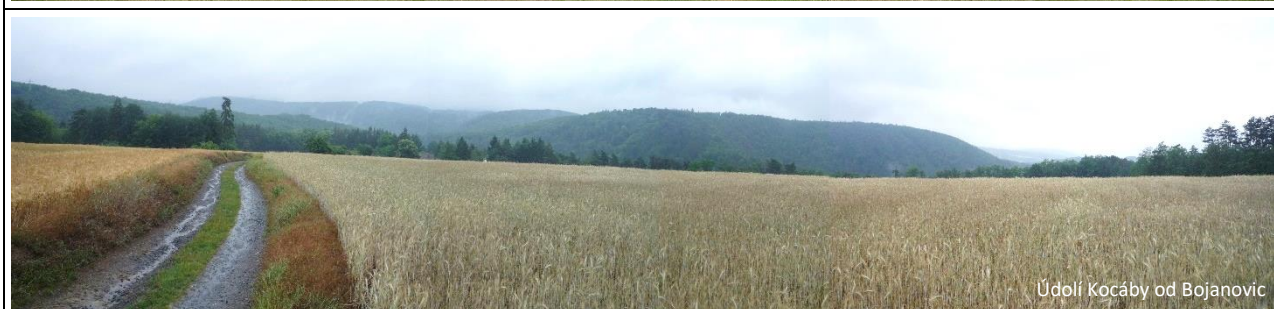
Údolí Kocáby od Bojanovic