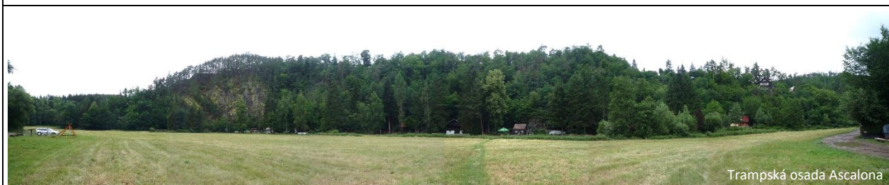
Trampská osada Ascalona