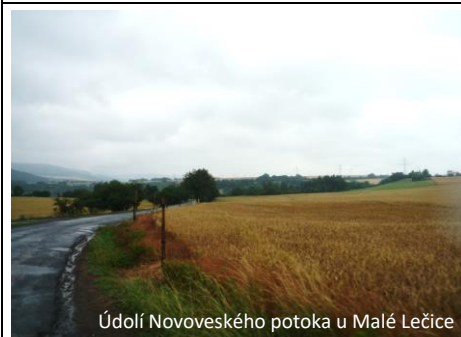
Údolí Novoveského potoka u Malé Lečice