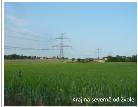
Krajina severně od Zvole