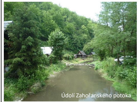
Údolí Zahořanského potoka