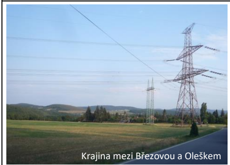
Krajina mezi Březovou a Oleškem