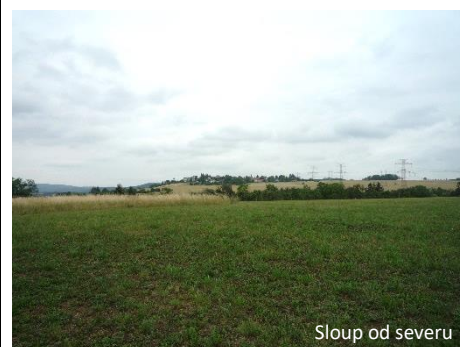
Sloup od severu