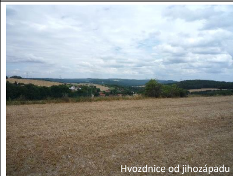
Hvozdnice od jihozápadu