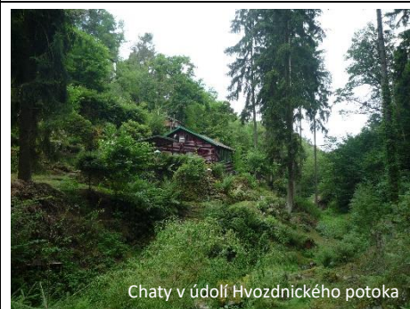
Chaty v údolí Hvozdnického potoka