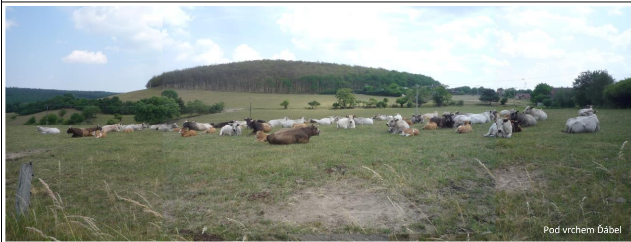
Pod vrchem Dábel