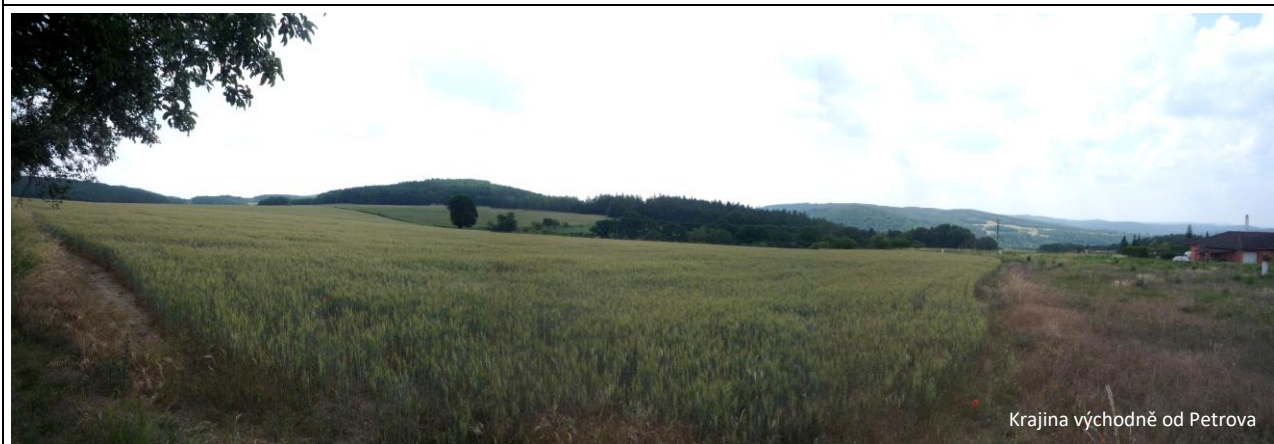
Krajina východně od Petrova