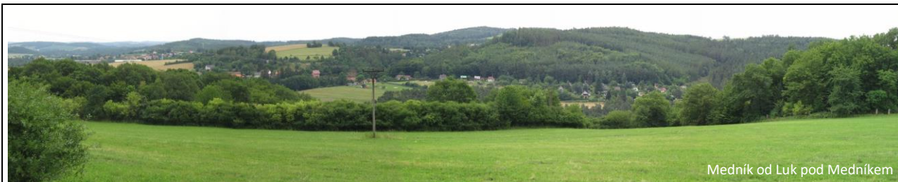
Medník od Luk pod Medníkem