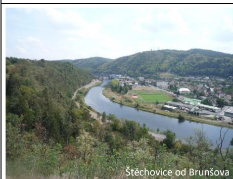
Štěchovice od Brunšova