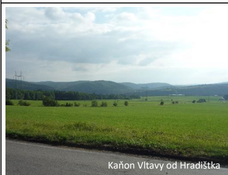
Kaňon Vltavy od Hradištka