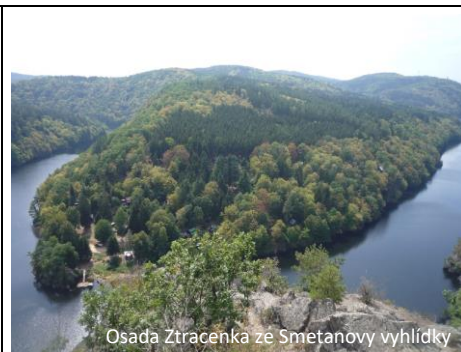
Osada Ztracenka ze Smetanovy vyhlídky