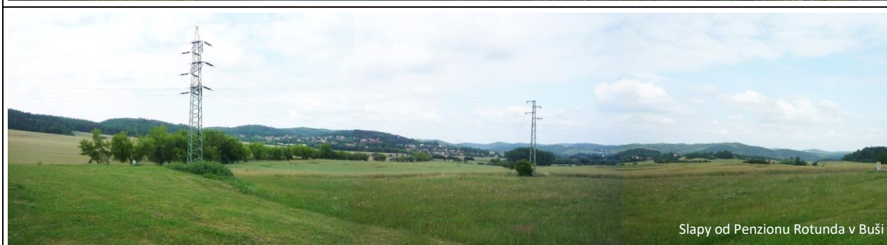
Slapy od Penzionu Rotunda v Buši