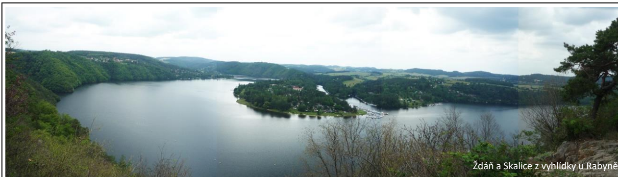
Ždán a Skalice z vyhlídky u Rabyně