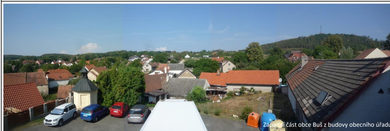
Západní část obce Buš z budovy obecního úřadu