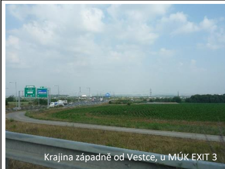
Krajina západně od Vestce, u MÚK EXIT 3