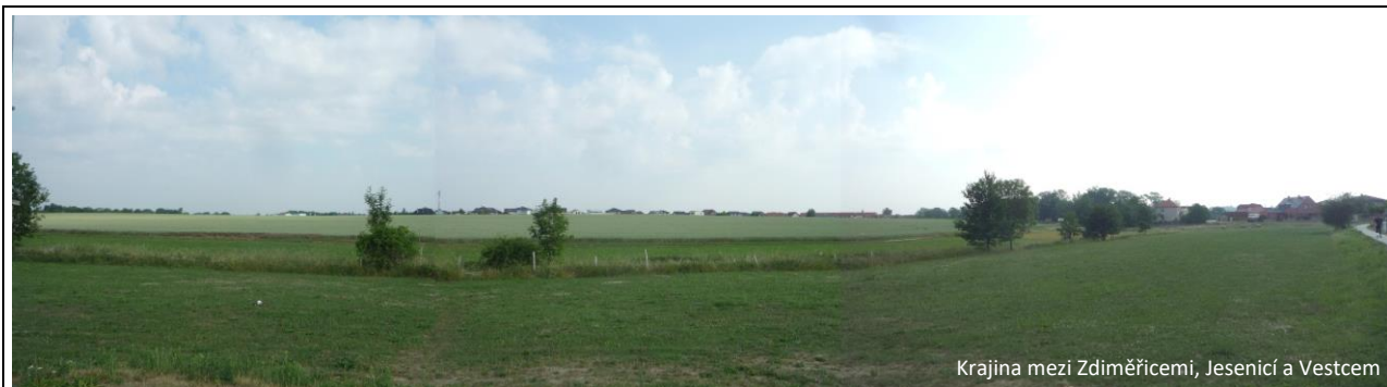
Krajina mezi Zdiměřicemi, Jesenicí a Vestcem