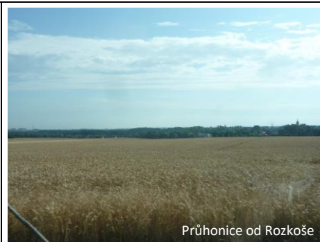
Průhonice od Rozkoše