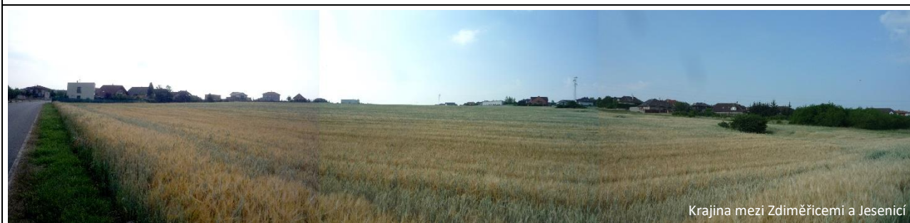
Krajina mezi Zdiměřicemi a Jesenicí