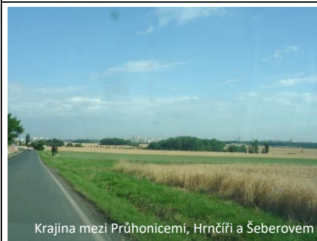
Krajina mezi Průhonicemi, Hrnčíří a Šeberovem