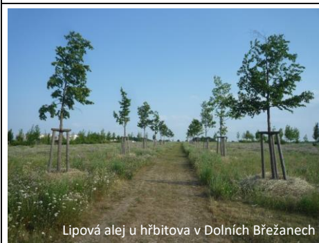
Lipová alej u hřbitova v Dolních Břežanech