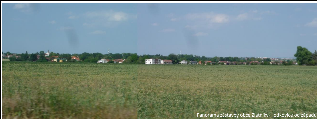
Panorama zástavby obce Zlatníky-Hodkovice od západu