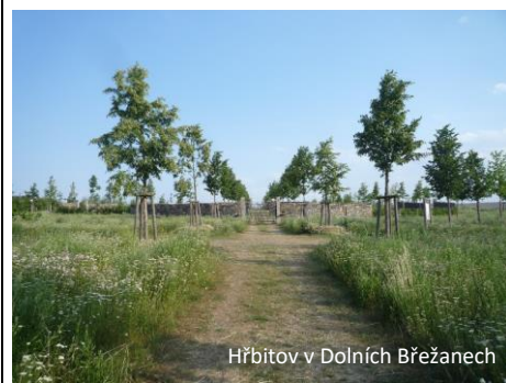
Hřbitov v Dolních Břežanech