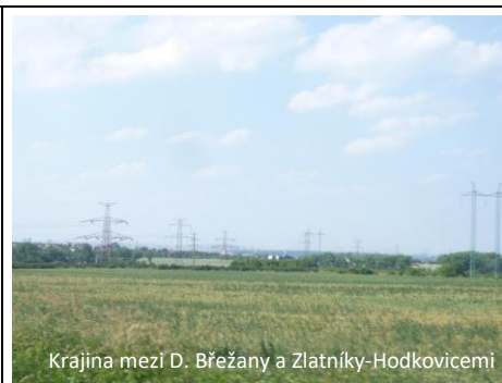
Krajina mezi D. Břežany a Zlatníky-Hodkovicemi