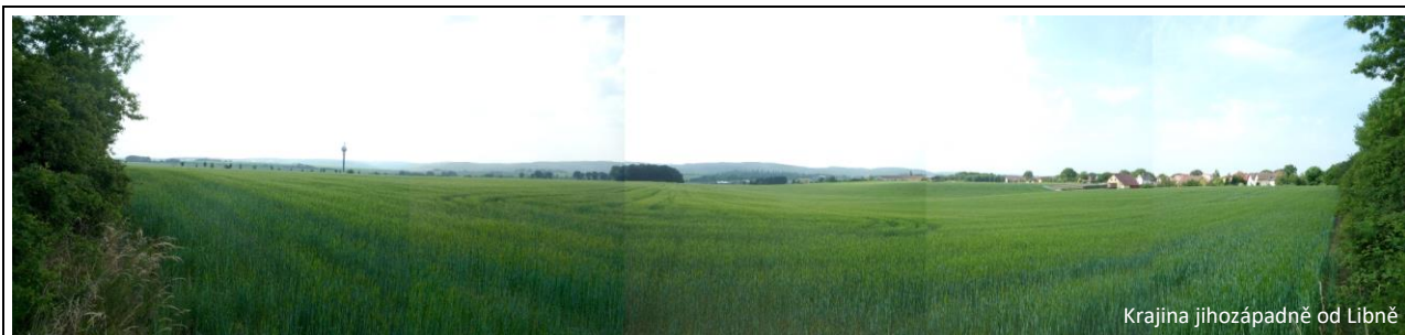
Krajina jihozápadně od Libně