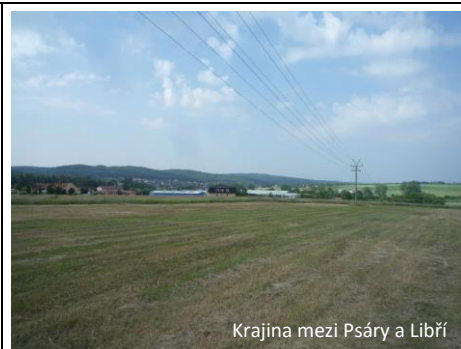
Krajina mezi Psáry a Liběň