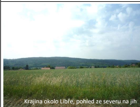
Krajina okolo Liběň, pohled ze severu na jih