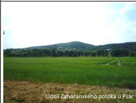
Údolí Zahořanského potoka u Psár