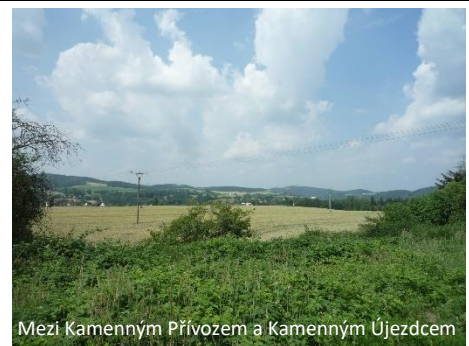
Mezi Kamenným Přívozem a Kamenným Újezdcem