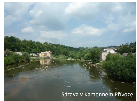
Sázava v Kamenném Přívoze