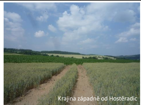
Krajina západně od Hostěradic