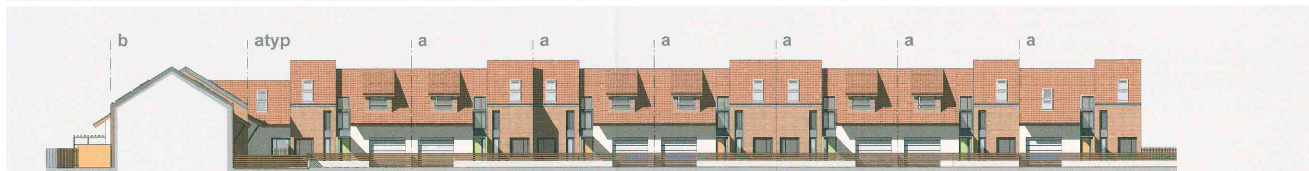
ŘEZOPHLED VÝCHODNÍ - řez vnitřní komunikací