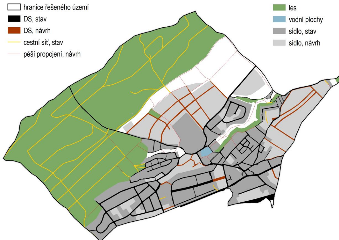
OBRÁZEK 2 SCHÉMA KONCEPCE PROSTUPNOSTI KRAJINY

Koncepce prostupnosti krajiny zachovává stávající cestní síť (respektování historických cest, viz schéma níže) v plochách s rozdílným způsobem využití (DS a DS1) a v liniích cestní sítě (např. v lese). Dále navrhuje nové plochy dopravní infrastruktury (DS v rozvojových plochách sídelních) a navrhuje nová pěší propojení v místech, kde chybí (viz schéma pěších propojení níže).