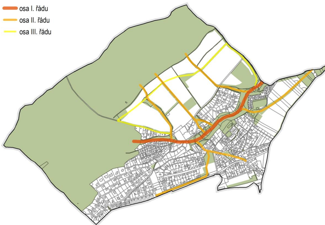
OBRÁZEK 1 SCHÉMA SYSTÉMU SÍDELNÍ ZELENĚ

Nové plochy sídelní zeleně jsou navrhovány v zastavitelných plochách Z01, Z03, Z05, Z06, Z07 (ZV a OH), Z10 a Z12. Plochy veřejné zeleně jsou navrženy spojitě, s návazností na stávající plochy zeleně a prostupnost sídlem stávající i navrhovanou (nová pěší propojení, viz kapitola A.5.4). Pro veřejnou zeleň byly vymezeny nevyužívané plochy uvnitř sídla, ve středu sídla vedle vodojemu (Z03), u bytových domů (ZV, stav), kolem rybníka u zámku (ZV1, stav) a u zahrádkové osady Ve Stružkách (Z07).